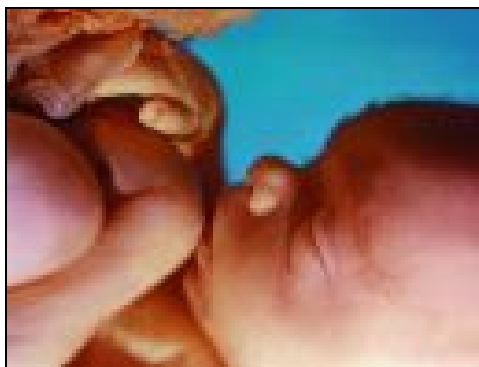
Plod dítěte ve 20.týdnu těhotenství