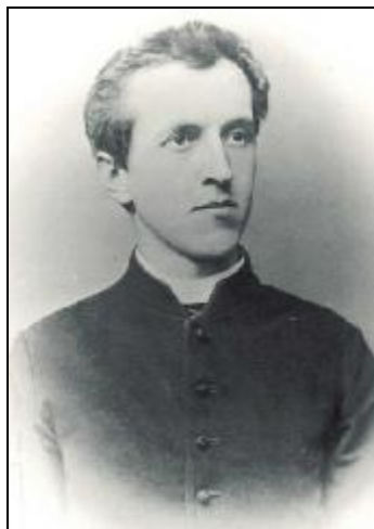
Dvojitá podoba stejného člověka – P. Alois Musil

Vzhledem k velkému časovému úseku, který dělí sepsání díla od jeho vydání, leccos nutně zastaralo, místy se vyskytují faktické nepřesnosti (na většinu z nich upozorňuje editor v poznámkovém aparátu), přesto i současný čtenář v ní najde mnoho cenných informací, především těch, jež vycházejí z důvěrné znalosti arabského, zvláště beduínského prostředí. Orient znal Musil nejen teoreticky z evropských knihoven, ale i bezprostředně z dlouholetých opakovaných pobytů "v terénu".