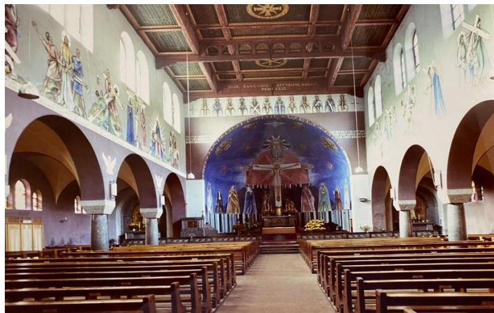
Interiér kostela Herz-Jesu Wiedikon v r. 1921