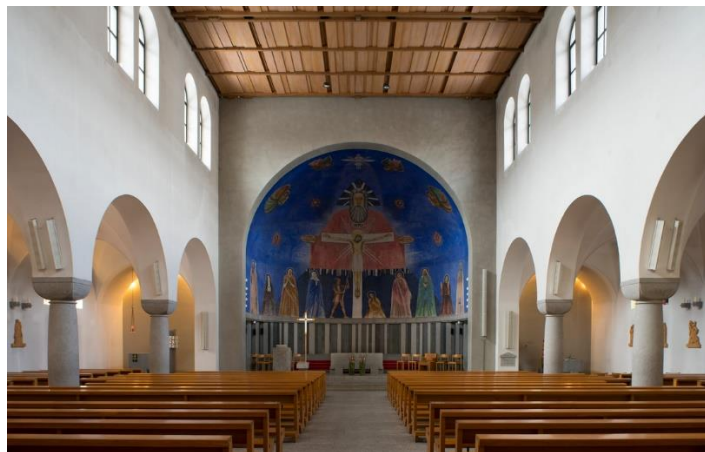
Tentýž interiér po mnoha úpravách v r. 2021