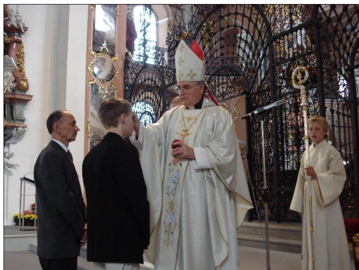
Otec biskup Petr Esterka při pouti do Einsiedeln v r. 2009

Otec biskup Esterka za svého působení pro krajany v zahraničí navštívil několikrát i nás krajany zde ve Švýcarsku. Domluvil také s místními biskupy pokračování české misie v Zürichu. Svůj vděk mu můžeme projevit modlitbou za jeho šťastný přechod do Božího království.