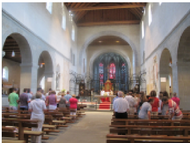
Zajatie a väznenie Metoda (870 – 873)