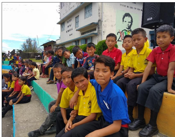
„Velká přestávka“ mezi vyučováním – říjen 2018